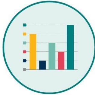
Öğrenci Eylem Planı