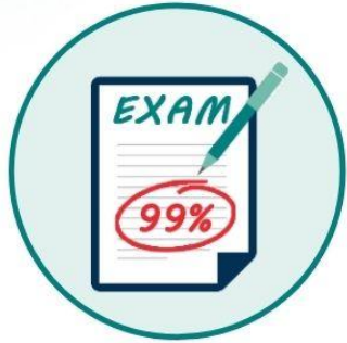
Final Kurs Sınavı